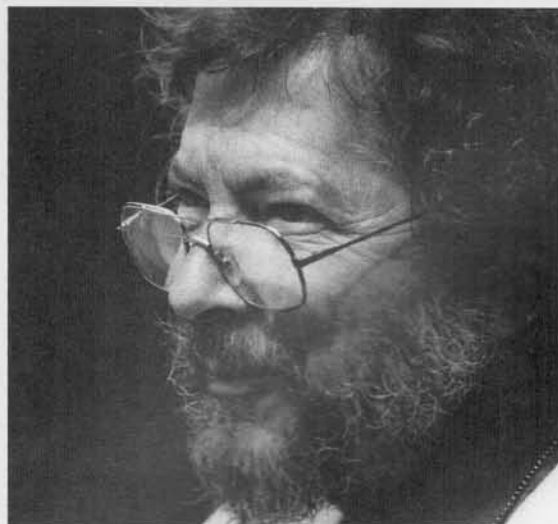
GILLES GROULX (1931-1994) monteur, réalisateur, scénariste et récipiendaire en 1985 du prix Albert-Tessier